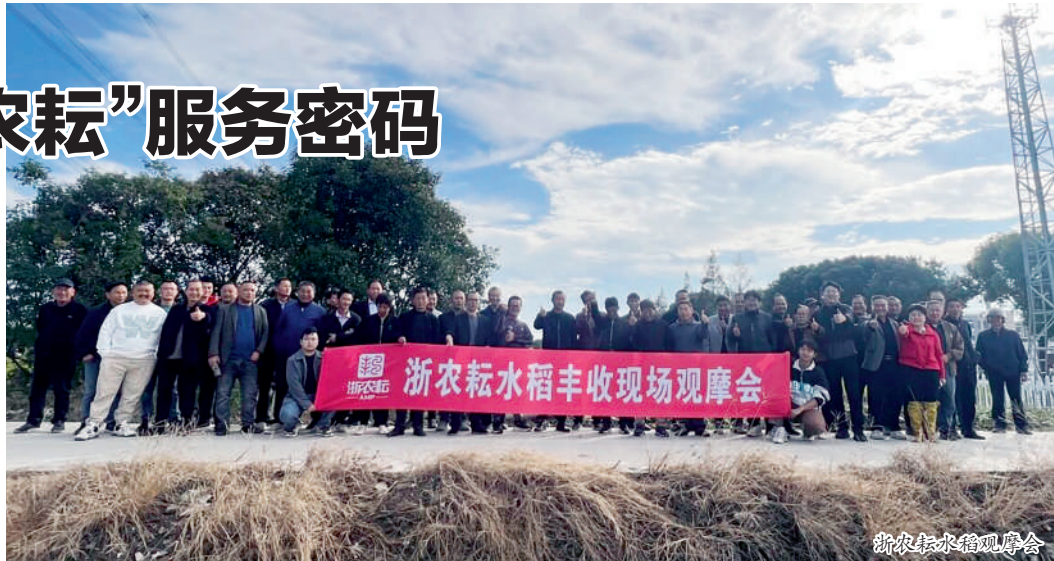
浙农耘水稻观摩会