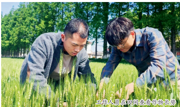
工作人员在田间查看作物长势

“浙农耘”农资套餐的成功打造,是浙农股份深耕资源建设、发力工贸协同的一个缩影。近年来,在持续深化全球化的采购渠道的同时,浙农股份积极谋划向产业链上游延伸,加快建设绿色肥药生产基地,“洛必达”“落地丰”“剑耕”等公司自有品牌产品取得良好市场反响。